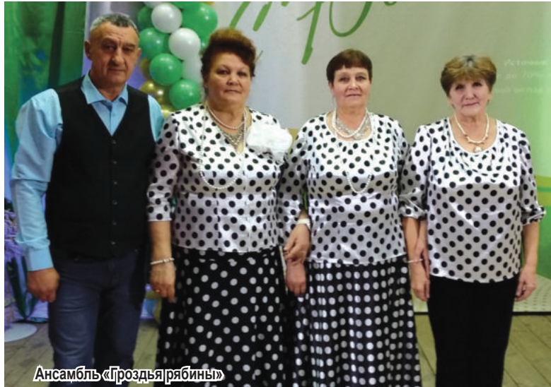
Ансамбль «Гроздья рябины»