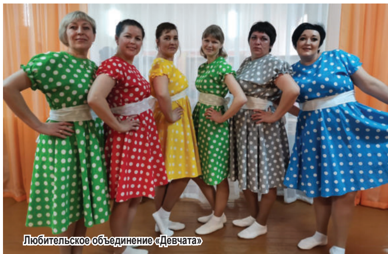
Любительское объединение «Девчата»