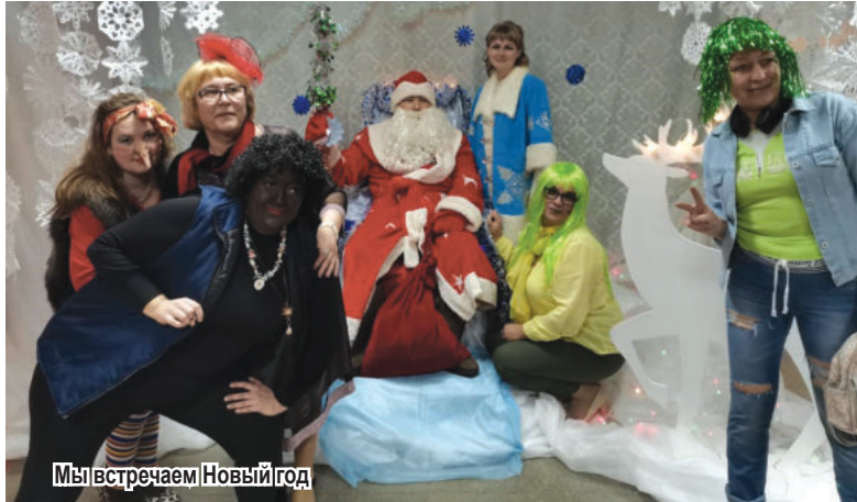
Мы встречаем Новый год

неоценимый вклад в становление своего учреждения, отдавая любимому делу все силы, талант, творческую энергию. Ведь в одиночку, всем известно, невозможно достичь никаких результатов, поэтому с 55-летием дома культуры мы поздравляем и всех участников художественной самодеятельности! Благодарим всех за активное участие в жизни нашего ДК.